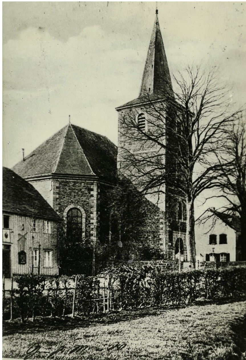
Unser ältestes Bild der ev. Kirche Roetgen (Foto ca. 1900), die 1782 eingeweiht wurde. Sie war Teil des Roetgener Ortzentrums am Ende des 18. Jahrhunderts.