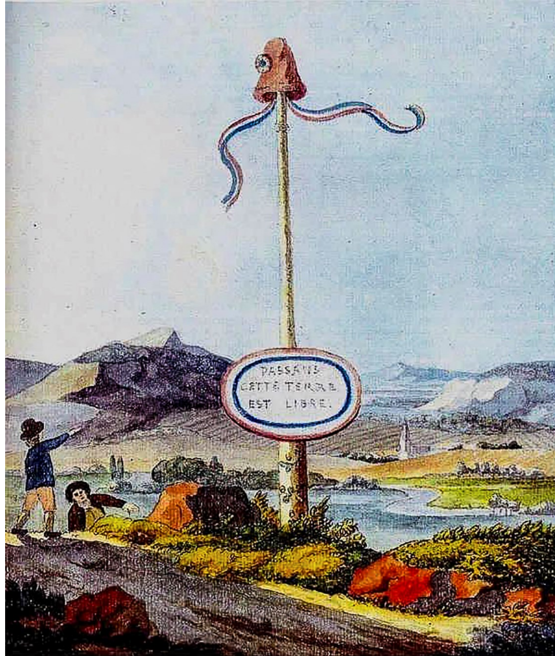
„Landschaft mit dem Freiheitsbaum“, Aquarell von J.W. v. Goethe, von 1792: In Roetgen wurde 1794 ein ähnlicher Freiheitsbaum auf dem Marktplatz errichtet.