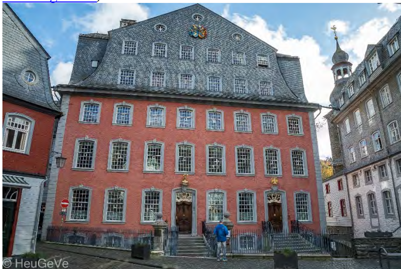
Die Villa der Familie Scheibler aus dem 18. Jh.

Am Sonntag, dem 26.05.2024, treffen wir uns um 15:00 Uhr in Monschau zum Besuch des Roten Hauses . Dort erwartet uns eine Führung von ca. 1,5 h innerhalb dieser historischen Villa. Details dieser Exkursion haben wir bereits in den RB-04/2024 veröffentlicht. Der Besuch kostet 5 € Eintritt plus anteilige Kosten für die Führung. Eine Anmeldung ist unbedingt erforderlich. Ansprechpartner dafür sind Ingrid Hamann ( ingrid.hamann.2501@gmail.com ) oder Peter Lauscher ( peterlauscher@gmx.de ).