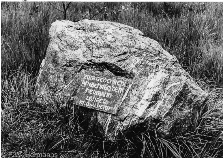
Der Gedenkstein aus den 1970er Jahren

Zum Andenken an diese Ereignisse errichtete man bald nach dem Unglück einen Gedenkstein mitten auf dem Struffelt. Man findet ihn heute ungefähr in der Nähe des Zusammentreffens des Weges, der aus dem Dreilägerbachtal kommt, mit dem Weg, der von Westen aus Rott in Richtung der Jägerhausstraße (K24) führt. Es ist auch in etwa die Stelle, wo in den 1930er Jahren drei Westwallbunker gebaut wurden, die damals als Artilleriebeobachter und Mannschaftsbunker gedacht waren. Nach dem 2. WK wurden sie gesprengt; Reste davon sind aber auch heute noch auffindbar.