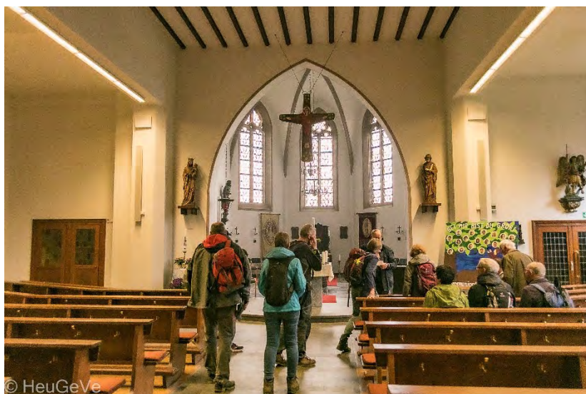
In der kath. Pfarrkirche St. Peter in Konzen

den, in diesem Jahr das Pankratiusfest an der Pfarrkirche in Konzen zu besuchen. Die GdG Kornelimünster, die Sternrouten und der HeuGeVe laden nun ein, den Kirchgang der Roetgener Vorfahren zum Pankratiusfest am Sonntag, dem 12.05.24, in einer begleiteten Wanderung nachzuerleben und in Konzen gemeinsam mit den Konzenern das Pankratiusfest zu feiern.