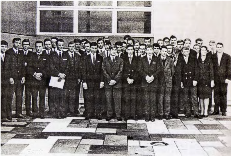
Die 1. Abschlussklasse der „Realschule für Jungen“, 1966